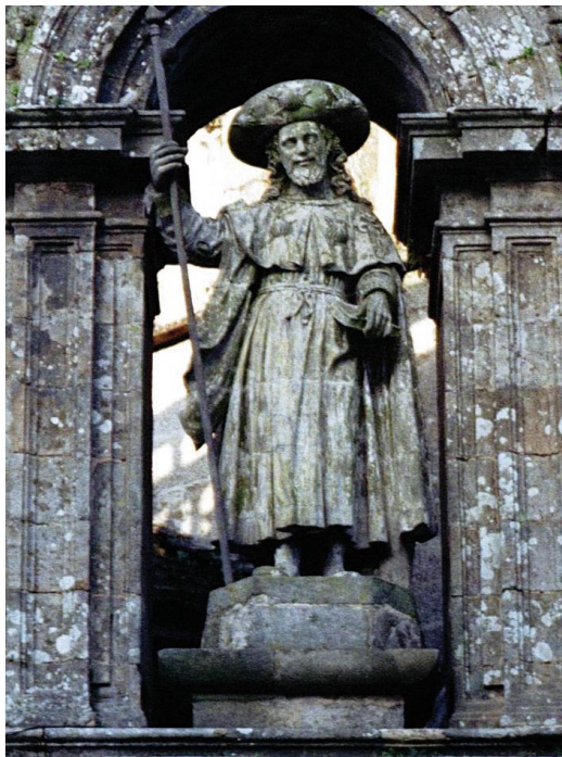
Figura Świętego Jakuba Większego Apostoła na murach katedry w Santiago