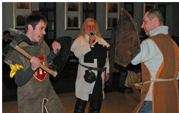
Rycerski turniej podczas konferencji szkoleniowej sołtysów w Rynie na Mazurach

Zwiedzanie zamku w Rynie spotkało się z dużym zainteresowaniem uczestników szkolenia, pomimo tego, że obecność była nieobowiązkowa. Zamek Ryn to czterogwiazdkowy hotel zlokalizowany w XIV-wiecznym zamku krzyżackim w Rynie,