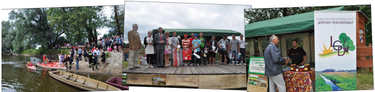
...w trakcie imprezy odbyły się XIII Gminne Zawody Kajakowe i V Mazowieckie Zawody Łódką Pychówką o puchar Marszałka Województwa, a Koło PZW z Wyszkowa zorganizowało otwarte zawody spławikowe szkółek wędkarskich.