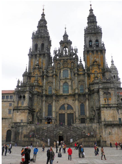
Katedra w Santiago de Compostela