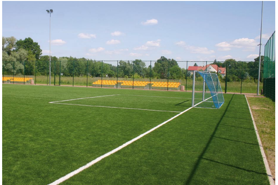
Nowoczesne, oświetlone i ogrodzone boisko ze sztucznej nawierzchni to także efekt udanej współpracy Gminy Brańszczyk z Lokalną Grupą Działania „Równiny Wołomińskiej”

Trzeba umieć słuchać ludzi i nie bać się podejmowania trudnych decyzji. To także umiejętność współpracy z każdym środowiskiem. Na sukcesy pracują wspólnie wójt i Rada Gminy, ale także cały zespół urzędników. Razem wyznaczamy sobie cele i staramy się je realizować. Rozmawiał Robert Sztylik