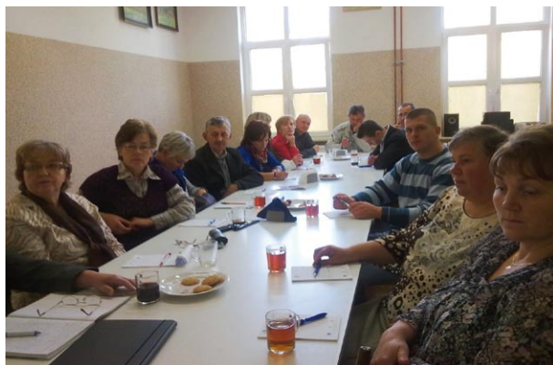
Jedno ze szkoleń sołtysów w jadowskim GOK-u...