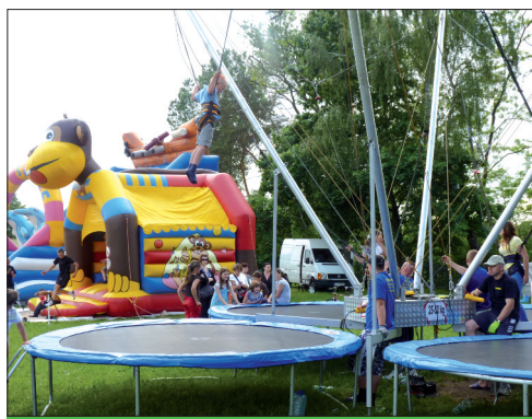
Małe Projekty – Gmina Zabrodzie, organizacja festynu z okazji Dnia Dziecka.