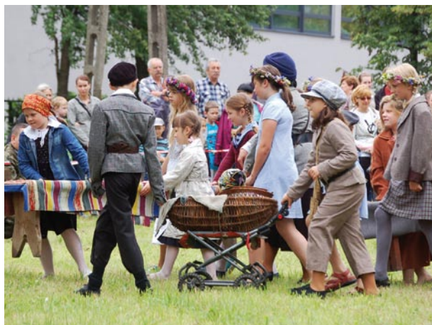
Także dzieci wzięły udział w tym historycznym spektaklu