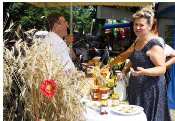
5 sierpnia 2013 r. – Festiwal Miodu i Chleba w Kamieńczyku