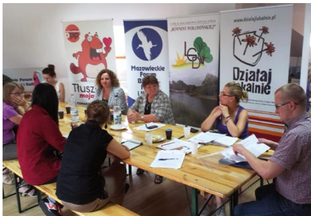
13 czerwca, szkolenie w siedzibie Klubu Aktywnych Mieszkańców Trzecia Strona w Wołominie