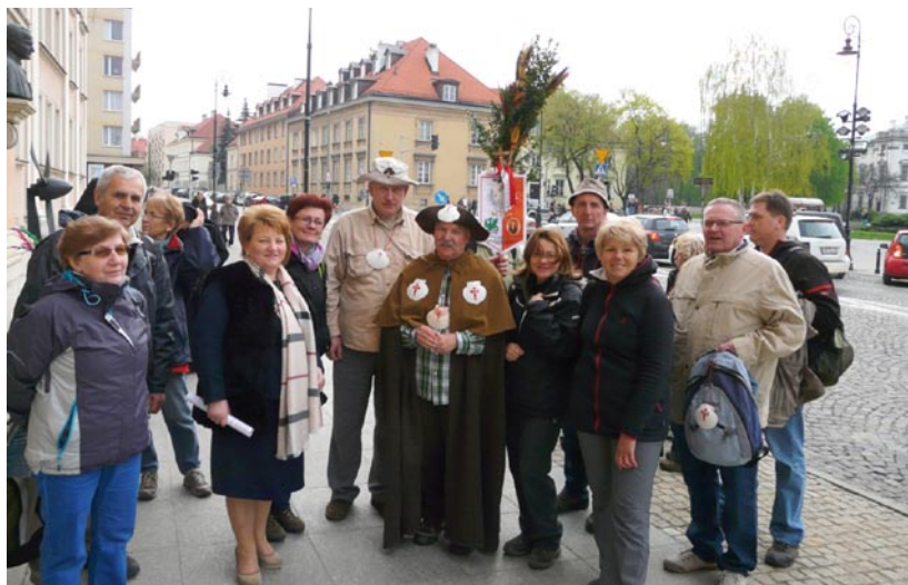
Pątnicy z Mazowieckiego Bractwa św. Jakuba przed Katedrą Polową Wojska Polskiego przy ul. Długiej w Warszawie, 13 kwietnia 2014 r.

Druga grupa (w tym pracownicy i członkowie naszej LGD) wyruszyła 26 kwietnia spod Kościoła św. Józefa Robotnika w Wołominie, a od Kobyłki szła już niemal tą samą trasą, co „pionierzy”. Tym razem jednak nie pogoda nie dopisała. Mimo rzęsiwego deszczu pielgrzymi kroczyli pewnie, w przekonaniu, że jeszcze mocniej muszą wydeptać ścieżkę św. Jakuba... R.Sz.