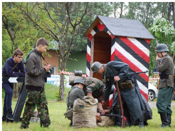
„Niemcy” ze Stowarzyszenia Historycznego Ostfront