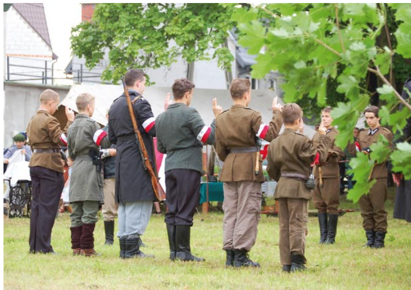
Przysięga wojskowa żołnierzy Armii Krajowej

Skrót artykułu zamieszczonego w „Stacji Tłuszcz”, nr 6-7/2014 z 1 lipca 2014 r.