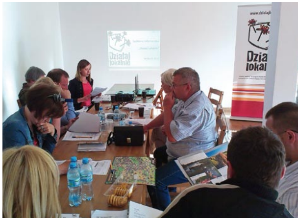
25 czerwca, szkolenie w Gospodarstwie Agroturystycznym „U Kaflika” w Brańszczyku