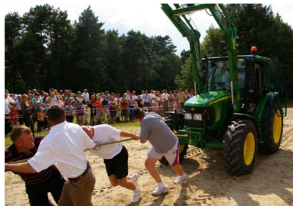
13 lipca 2014 r. – Igrzyska sportowo-rekreacyjne w Gulczewie