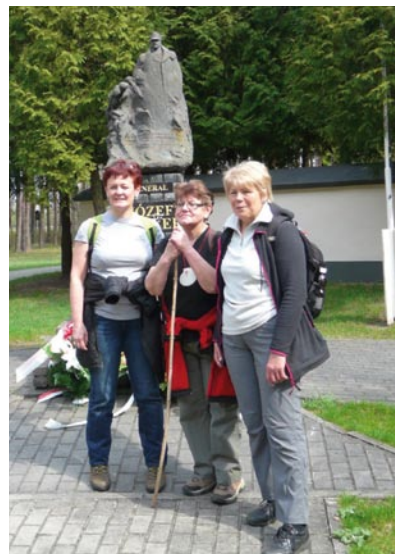
Pielgrzymi przy pomniku gen. Józefa Hallera w Ossowie