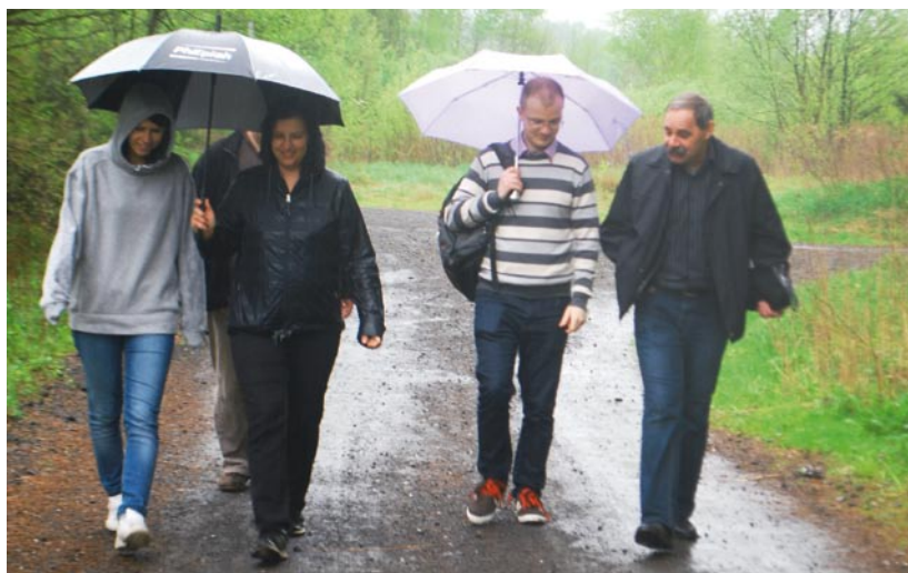
Przemierzanie szlaku 26 kwietnia utrudniały ulewne deszcze