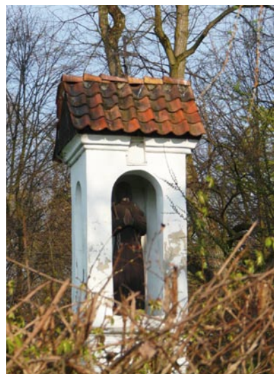
Domagająca się renowacji zabytkowa kapliczka św. Jakuba w Ciemnym koło Radzimina